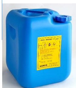
業務用 20 kg