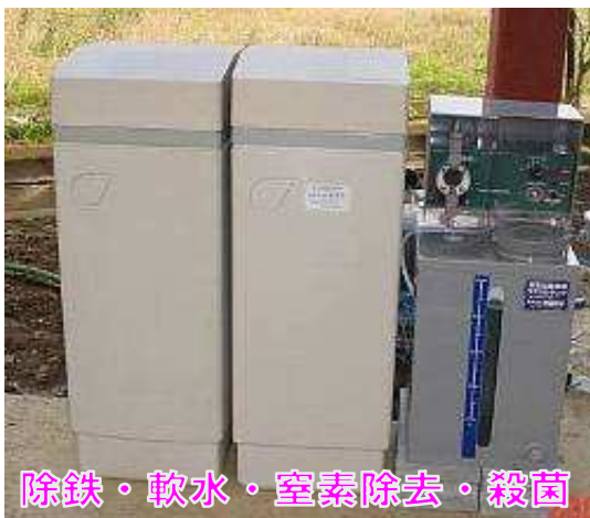
砂取りスピンドルフィルター20A用

お風呂・洗濯・食器洗いなどで、軟水の良さが味わえます。 保湿効果が有りむ、お肌がスベスベに成ります。 石鹸・洗剤が半分以下ですみます。 湯沸かし器・温水器・ボイラー・配管の寿命30%アップします。 衣類・タオル・リネン材の寿命30%アップします。